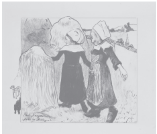
Volpini-serie, Paul Gauguin, De genietingen van Bretagne , 1889