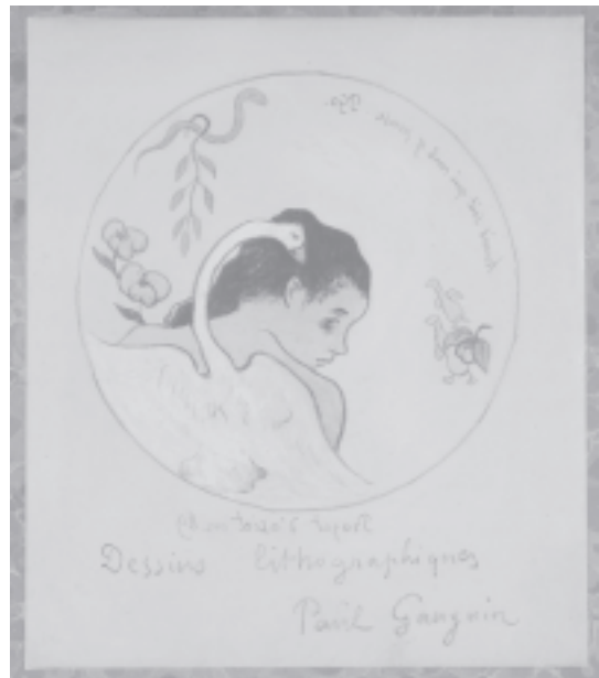
Volpini-serie, Paul Gauguin, Leda en de zwaan, 1889