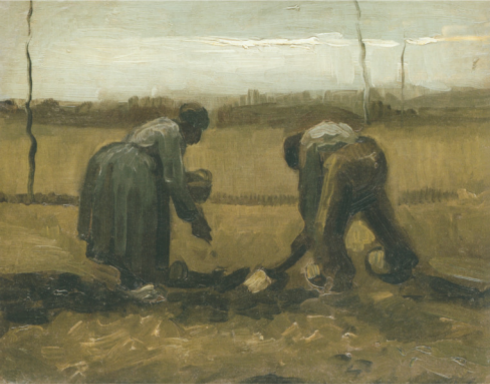
6 Vincent van Gogh Boer en boerin die aardappelen planten, 1885 Kunsthau, Zürich

De Goncourt, Richepin, Daudet, Huysmans is prachtig en men kan ternauwernood gezegd worden tot zijn tijd te horen, als men er geen kennis van heeft genomen.'