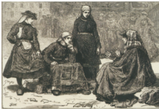
7 Francis S. Walker Group of five girls Gegraveerd door William James Palmer, in The Illustrated London News 66 (17 februari 1875)