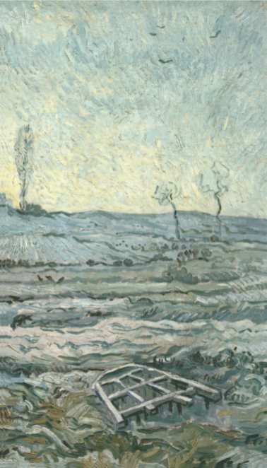
52 Vincent van Gogh Oudengesezuid veld met zee eg (naar Millet), 1890 Van Gogh Museum, Amsterdam