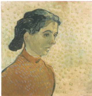
54 Vincent van Gogh Sterrennacht boven de Rhône (detail), 1888 Musée d'Orsay, Parijs