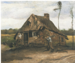
49 Vincent van Gogh Barrenhuis met thuis- komende man, 1885 Museo Soumaya, Mexico City