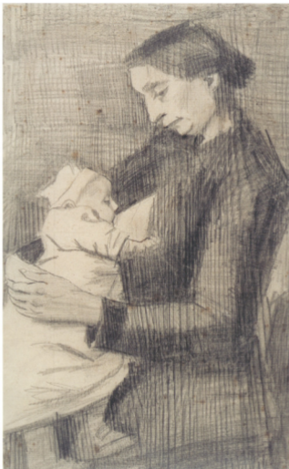
14 Vincent van Gogh Sits die haar baby soed, 1882 Kröller-Müller Museum, Otterlo