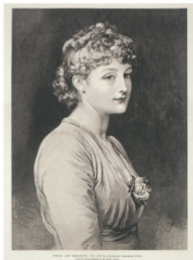
8 Frederick Leighton Type of beauty, nr. 6 Gegraveerd door C. Roberts, in The Graphic 24 (24 december 1881)