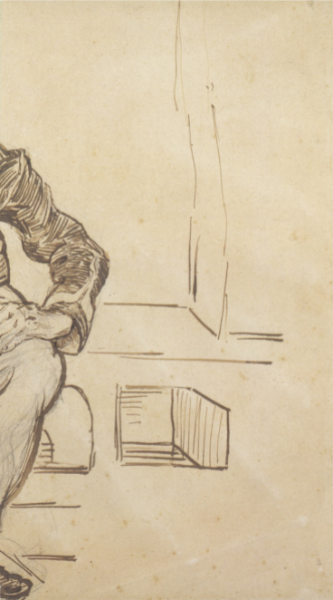
40 Vincent van Gogh De zeraaf, 1888 Van Gogh Museum, Amsterdam