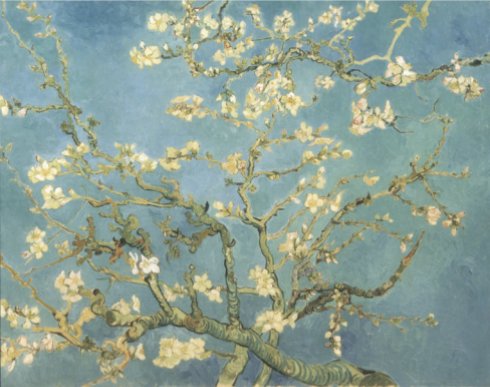
53 Vincent van Gogh Amandelbloesem, 1890 Van Gogh Museum, Amsterdam

gras, het gele koren, de boer, dat wil zeggen dat je uit je liefde voor de mensen niet alleen moed put om te werken, maar ook om je te troosten en op krachten te komen, als je daar behoefte aan hebt.'