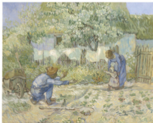
50 Vincent van Gogh De eerste stappen (naar Millet), 1890 The Metropolitan Museum of Art, New York