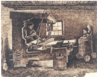
48 Vincent van Gogh Wever, en baby in een kinderstoel, 1884 Van Gogh Museum, Amsterdam

toen hij het nieuws vernam meteen aan Amandelbloesem , bedoeld om in hun slaapkamer te hangen (53). Kort voor zijn dood maakte hij een opmerkelijke vergelijking tussen het opvoeden van kinderen en het maken van schilderijen: 'Ik geloof dat het stellig beter is kinderen op te voeden dan je met al je geestkracht op het schilderen te storten, maar wat wil je, ik ben nu, althans ik voel me nu te oud om op mijn schreden terug te keren of om zin te hebben in iets anders. Die lust is me vergaan, hoewel de pijn van binnen blijft.' Hij moet die schrijnende pijn jarenlang hebben gevoeld.