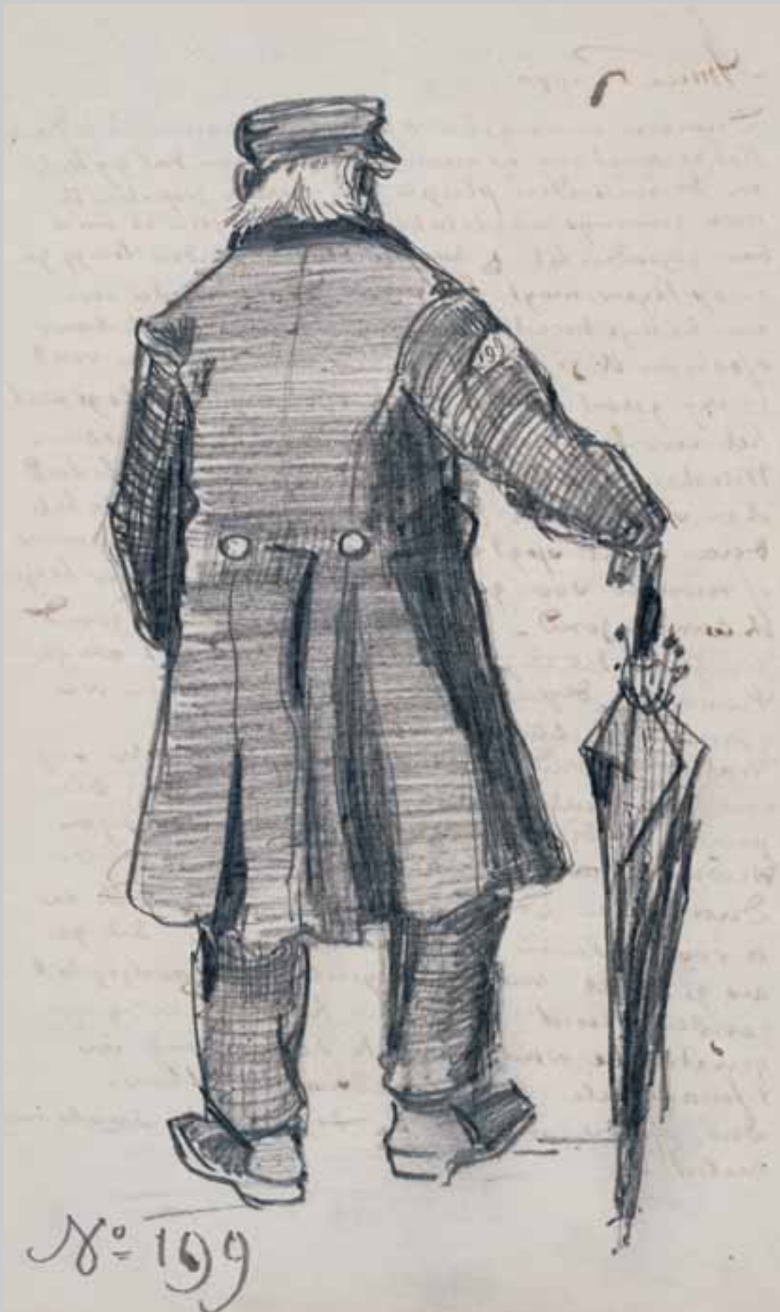
Brief van Vincent van Gogh aan Anthon van Rappard (269/R14), Den Haag, c. 23 september 1882