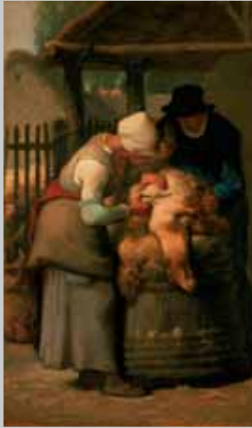
Jean-François Millet, Schapen scheren , 1852-53, Museum of Fine Arts, Boston