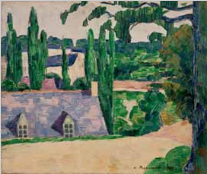
Emile Bernard, Landschap te Pont Aven , 1889, privé-collectie