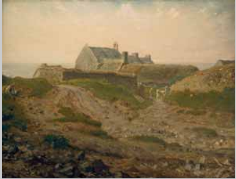
Jean-François Millet, Priorij bij Vauville , 1872-74, Museum of Fine Arts, Boston

schap te Pont-Aven van Emile Bernard uit een privécollectie (voor langere duur). Dit is een vruchtbare manier om de presentatie op zaal te verrijken. De komende jaren worden de mogelijkheden onderzocht om meer bruiklenen uit andere musea te kunnen tonen.