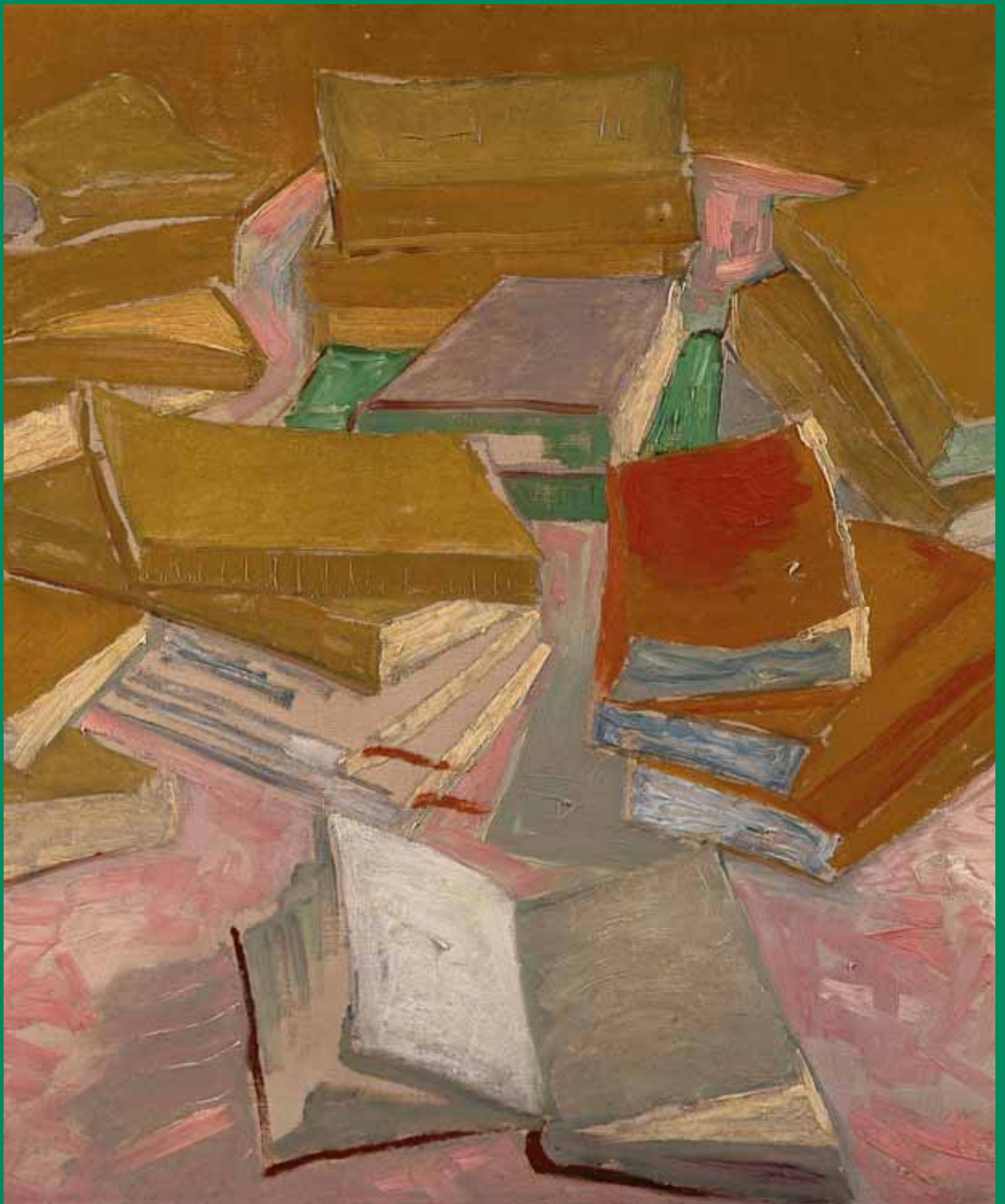
Vincent van Gogh, Studie voor 'Romans Parisiens' , 1887-1888 (detail)