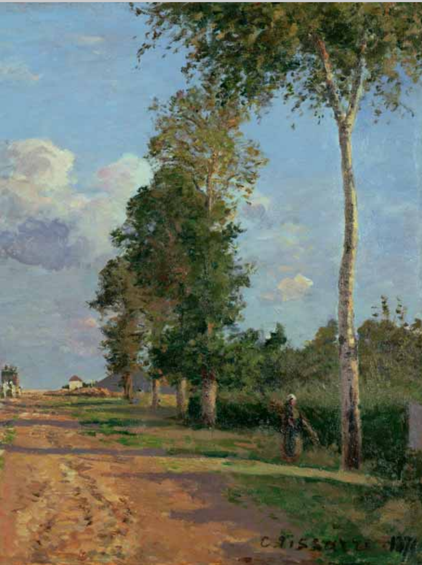
Camille Pissarro, Route de Versailles, Rocquencourt , 1871