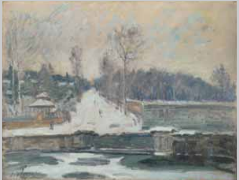
Alfred Sisley, Het bassin in Marly-le-Roi , 1875, The National Gallery, Londen

Van Museum Mesdag werden vijf werken behandeld: twee van Daubigny (hwm 91 en 95) en drie van Rousseau (hwm 288, 289 en 292). De behandeling van de schilderijen van Daubigny maakt deel uit van een integrale aanpak van diens doeken in de Mesdagcollectie, waarbij veel inzichten in de werkwijze van de kunstenaar worden verkregen. Om vergelijkbare redenen werden de drie werken van Rousseau als groep behandeld.