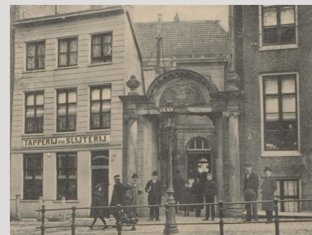
Oudemanshuispoort, ca. 1900