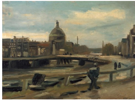
Vincent van Gogh, Gezicht op Amsterdam , 1885 Collectie Stichting P. en N. de Boer, Amsterdam

Toen Vincent in 1885 naar Amsterdam kwam om het Rijksmuseum te bezoeken, maakte hij twee stadsgezichten vanuit het hulpstation. Er werd op dat moment druk gebouwd aan het huidige Centraal Station. Het uitzicht op dit schilderij is nog steeds herkenbaar. Hoor er meer over in de audiostop.