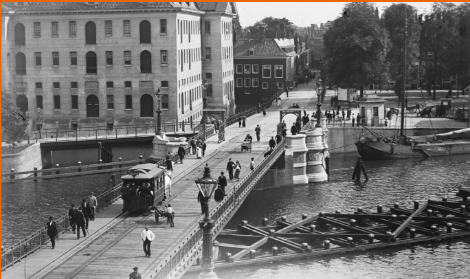
Marinewerf en verblijfplaats van Vincent, 1899

Vincent kwam in mei 1877 aan in Amsterdam. Op dat moment dacht hij nog helemaal niet aan het kunstenaarschap. Vincent wilde theologie gaan studeren zodat hij dominee kon worden, net als zijn vader. Hij had zijn middelbare school nooit afgemaakt en kwam naar de stad om zich voor te bereiden op een staatsexamen gymnasium. Hij woonde bij zijn oom Jan op de marinewerf. Van 's ochtends vroeg tot 's avonds laat studeerde hij op Grieks, Latijn, meetkunde en algebra. In zijn vrije uurtjes wandelde hij door de stad, bezocht hij een van de kerken of musea en ging hij langs bij familie.