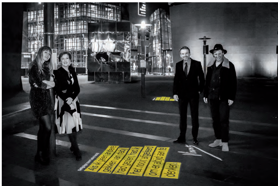
Van Gogh belicht

In een speciaal brievenonderdeel op de website konden bezoekers hun favoriete citaat uit Van Goghs brieven markeren en online delen. De mooiste citaten die werden gemarkeerd werden verzameld en geprojecteerd in Van Gogh-straten door het hele land. De aftrap van deze 'highlights-expositie' met citaten - uitgekozen door Loes Luca, Akwasi, Adriaan van Dis, Lucky Fonz III, Janne Schra en Ellen Deckwitz - waren te bewonderen bij de lantaarnpalen op het Museumplein.