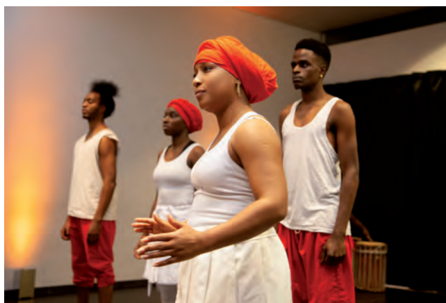
Verkeerd Verbonden