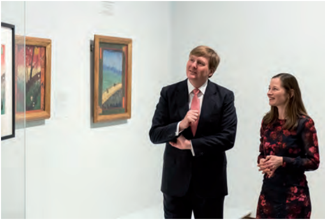
Zijne Majesteit de Koning en conservator Nienke Bakker