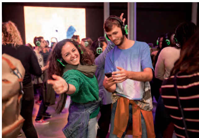
Silent Disco tijdens Vincent op Vrijdag