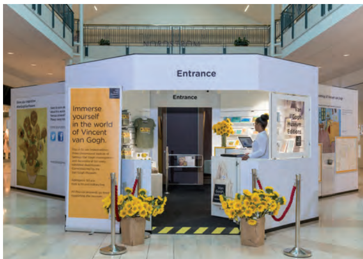
Pop-up in Philadelphia

Merchandiseverkoop is in 2018 wederom gestegen. Extra sterk was de groei van het luxere assortiment en van de licentieartikelen die via onze eigen verkoopkanalen werden aangeboden. In 2018 is de Bookshop vernieuwd, wat heeft geresulteerd in een inspirerende en toegankelijke winkel waarbij de connectie met het museum en Van Gogh als kunstenaar centraal staan.