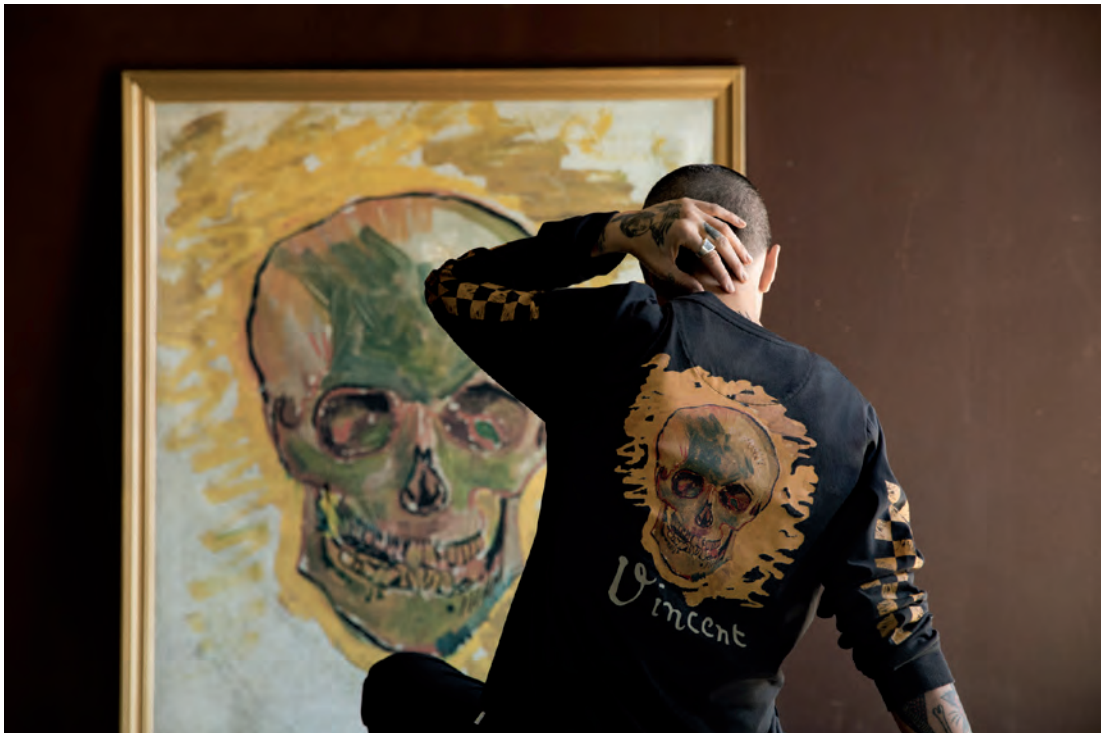
Vans x Van Gogh Museum

De meeste commerciële activiteiten van het museum zijn ondergebracht binnen de bv Van Gogh Museum Enterprises (hierna: VGME). VGME ontwikkelt producten en diensten geïnspireerd op het leven en werk van Vincent van Gogh en is altijd op zoek naar nieuwe invalshoeken om zijn werk voor een zo breed mogelijk publiek toegankelijk te maken. De activiteiten richten zich op lokaal, mondiaal en digitaal niveau. VGME vormt een zeer belangrijk onderdeel van de inkomstenstructuur van het museum.