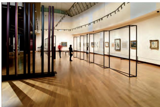
Gauguin & Laval op Martinique