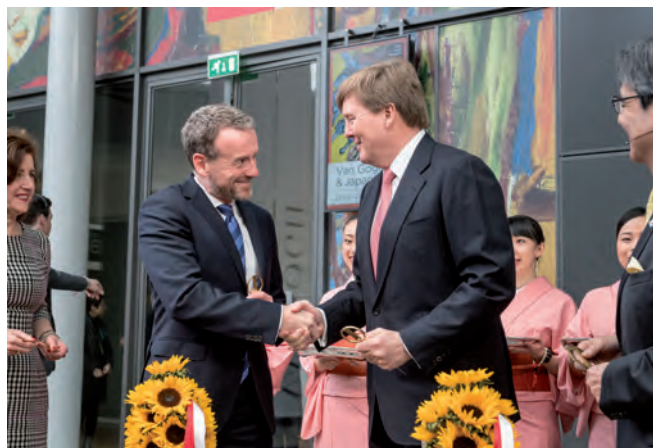
Opening Van Gogh & Japan