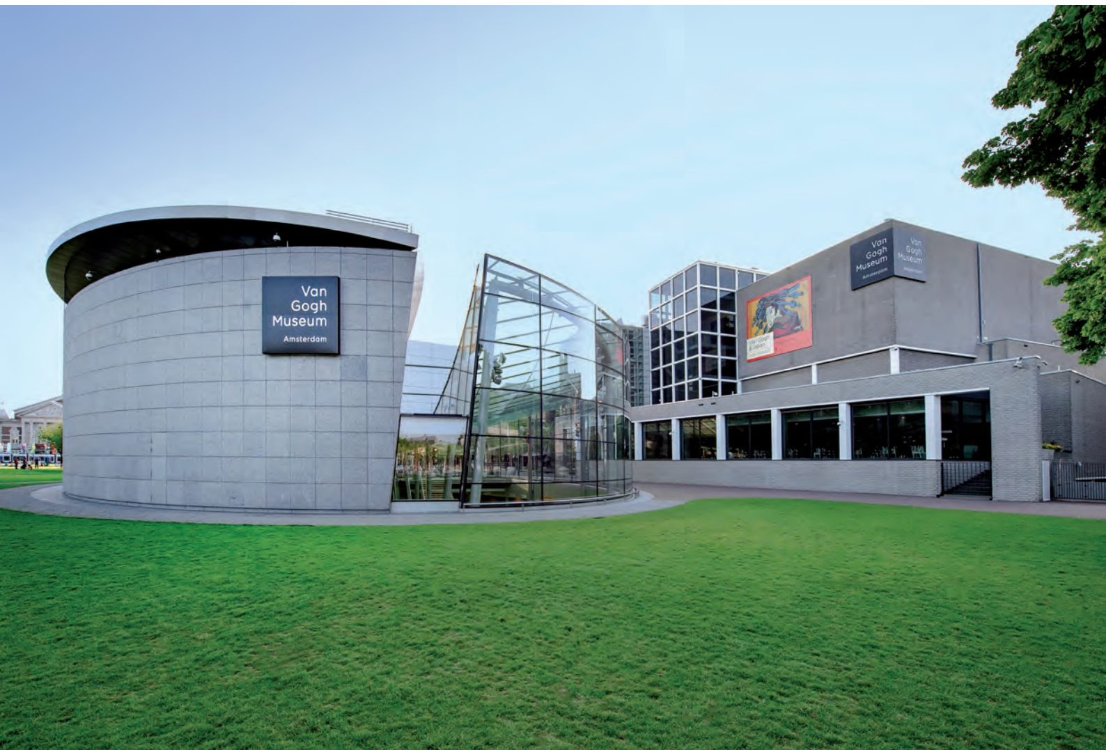
Van Gogh Museum

Naast de presentatie van de vaste collectie organiseert het VGM een uitgebreid programma van tijdelijke tentoonstellingen. Jaarlijks zijn er twee grote tentoonstellingen en een meer bescheiden zomerpresentatie in de tentoonstellingsvleugel van het museum. Daarnaast worden in het Rietveldgebouw kleinere tentoonstellingen van hedendaagse kunstenaars gehouden.