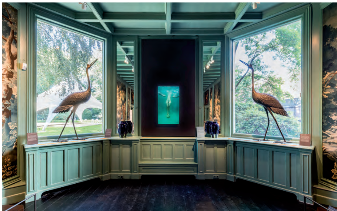
De zindering van de zee

De Mesdag Collectie in Den Haag toont de collectie van de kunstenaars en verzamelaars Hendrik Willem Mesdag en zijn vrouw Sientje Mesdag-van Houten. Het museum vormt samen met het Van Gogh Museum de Stichting Van Gogh Museum. De collecties van beide musea sluiten mooi op elkaar aan en geven een goed overzicht van de kunst van de late 19de eeuw. In DMC worden jaarlijks twee tentoonstellingen georganiseerd.