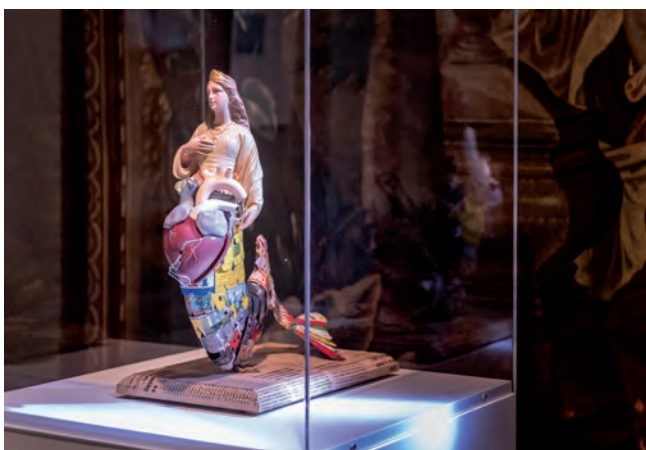
De zindering van de zee

als motor van de verbeelding en de performance In Search of the Miraculous van Bas Jan Ader, die in 1975 verdween toen hij de Atlantische Oceaan over wilde zeilen. De tentoonstelling was een geslaagd voorbeeld van hoe hedendaagse kunst en 19de-eeuwse kunst kunnen samengaan en aanleiding kunnen geven tot nieuwe accenten en invalshoeken.