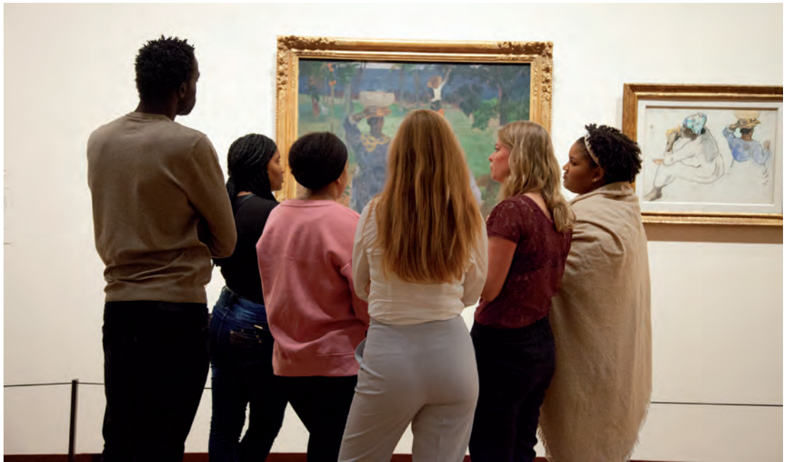
Bezoekers Gauguin & Laval op Martinique

De activiteiten van de sector Publiekszaken zijn erop gericht de kunstschat en kennis van het VGM uit te dragen en verder toegankelijk te maken voor uiteenlopende doelgroepen, zowel nationaal als internationaal. Onder deze sector vallen de afdelingen Marketing, Pers, Development, Bezoekersservice, Publicaties, Events en Digitale Communicatie.