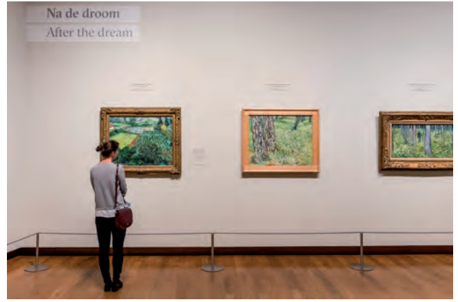
Van Gogh & Japan