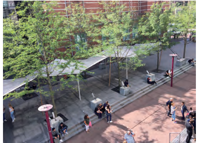
Wachtgebied zomerpiek 2018

gram verdubbelde het aantal volgers naar ruim 900.000 en het engagement groeide exceptioneel van 4 naar 9,1 miljoen. Twitter telt ruim 1,6 miljoen fans en onze Facebookpagina's hebben gezamenlijk meer dan 4,7 miljoen volgers. Niet eerder werd de website van het museum zo vaak bezocht: meer dan 6,7 miljoen keer. De belangstelling betrof vooral Van Gogh & Japan , de campagne Van Gogh belicht: de brieven , de samenwerking met modemerken Vans en de 165ste verjaardag van Van Gogh op 30 maart 2018, die werd gevierd met onder meer de #VanGoghCelebrates-actie en de oprichting van een inspiratie-community op Facebook: Van Gogh Inspires .