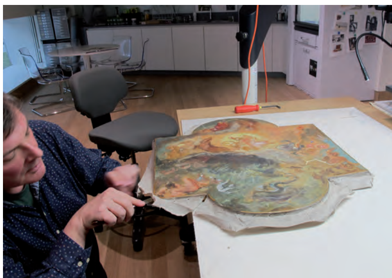
De vernisafname