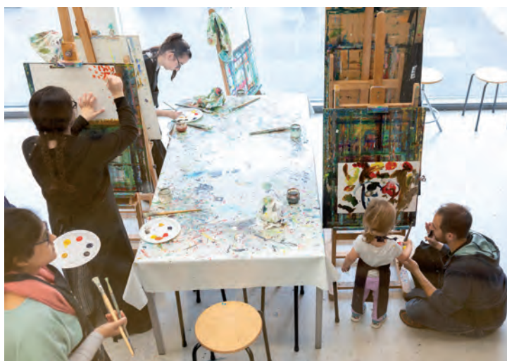
Schilderatelier tijdens de Familiedagen

Voor deze tentoonstelling werd met succes ingezet op extra aandacht in Franse media, met het oog op de enorme populariteit van met name Gauguin bij het Franse publiek.