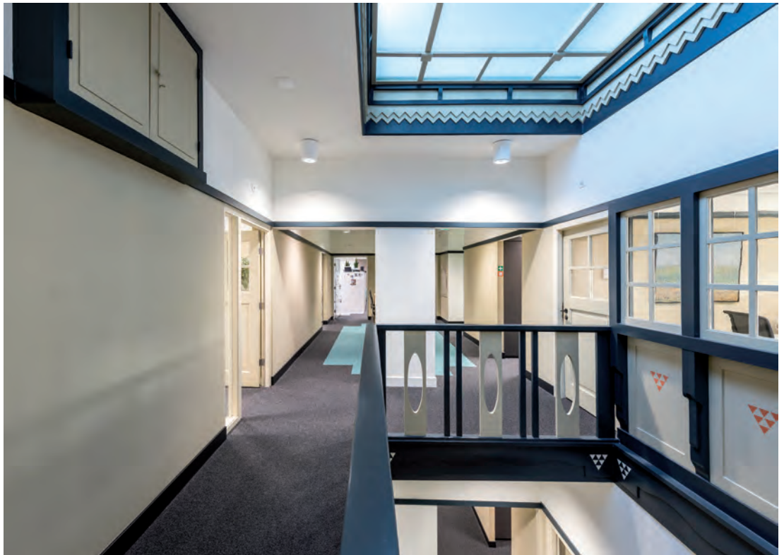
Kantoor Gabriël Metsstraat

Het VGM profileert zich toonaangevend op het gebied van museale bedrijfsvoering, en heeft daarbij de ambitie om zich te ontwikkelen tot een van de meest duurzame musea van Europa. Het museum streeft ernaar een aantrekkelijke werkgever te zijn. De sector Bedrijfsvoering omvat de afdelingen Facilitair Bedrijf, Beveiliging, HR, ICT en Financiën.