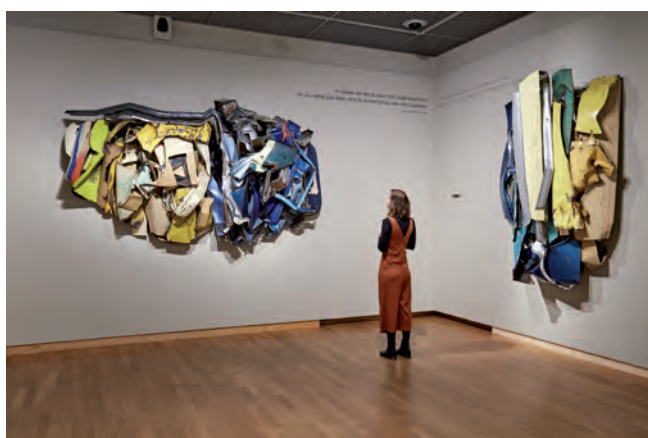
Van Gogh inspireert: John Chamberlain