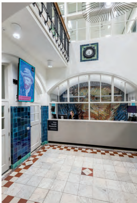
Entree Gabriël Metsstraat 8

Eind januari 2018 is het nieuwe kantoorpand in gebruik genomen in de directe nabijheid van het VGM. Het prachtig gerenoveerde gebouw aan de Gabriël Metsstraat 8 deed oorspronkelijk dienst als de Nieuwe Huishoudschool, in 1907 ontworpen door J.H.W. Leliman. Veel originele elementen zijn bewaard gebleven. In de aankleding en de inrichting is, onder meer in het kleurgebruik, gepoogd een brug te slaan met de wereld van Van Gogh. Het resultaat – mét BREEAM duurzaamheidskeurmerk – is een hoogwaardige omgeving die past bij de status en de uitstraling van het museum en waar het prettig werken is.