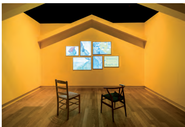
Van Gogh droomt