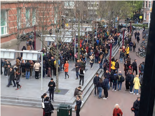
Wachtgebied winterpiek 2017