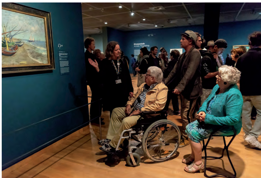
Deelnemers Van Gogh ontmoet

Naar aanleiding van de impactonderzoeken zal dit programma worden doorontwikkeld en zal de leerlijn met vmbo worden versterkt. De pilots waarbij partners uit het Van Gogh verbindt -netwerk co-programmeerden tijdens de Vincent op Vrijdag-avonden waren succesvol en zullen in 2019 worden voortgezet. Dat Van Gogh verbindt (inter)nationaal wordt gezien als een voorbeeld, blijkt uit opname in de Verkenning Amsterdamse Kunstraad 2019, uit de nominatie voor de &Award 2018 (Cultuur & Creatief Inclusief) en uit de vele vragen uit het veld.