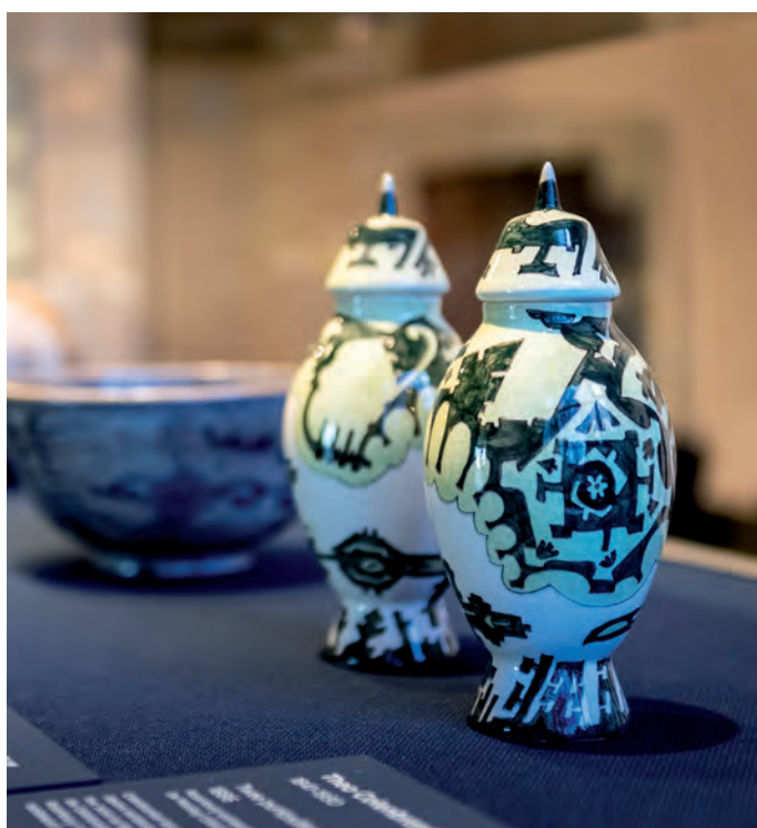
Mesdag & Japan