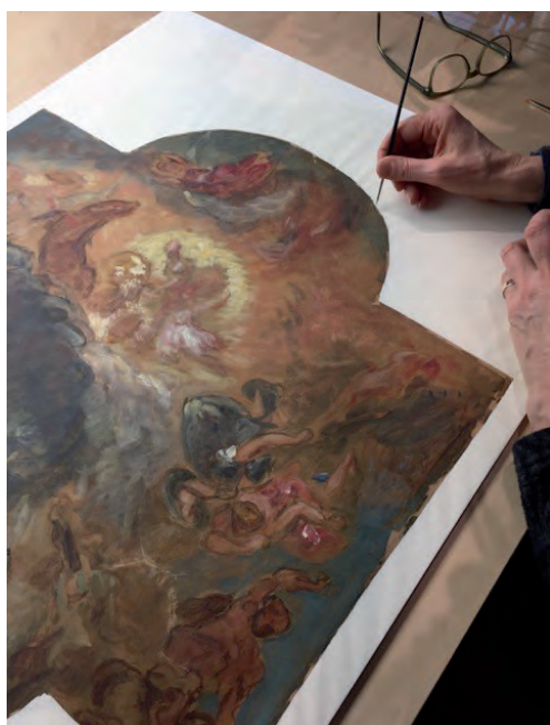
Het afspannen van het doubleerlinnen waar het papier op was geplakt

De volledige lijst van behandelde werken is te vinden in de bijlage Behandelde werken .