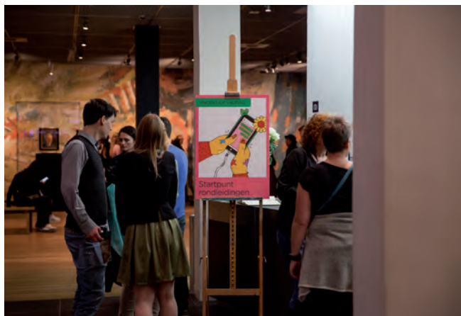
Vincent op Vrijdag