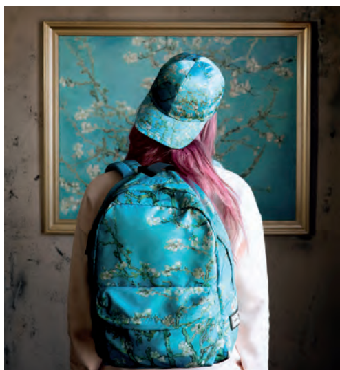
Vans x Van Gogh Museum